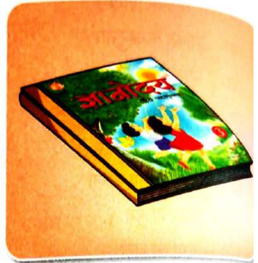
ज्ञानोदय हिंदी की पुस्तक है।