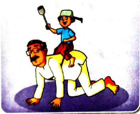
बुढ़ापे में व्यक्ति बच्चा बन जाता है।