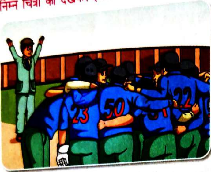
कोलकाता में ईडन गार्डन है।

निम्न चित्रों को देखकर इनके नीचे लिखे वाक्यों को पढ़ें एवं समझें—